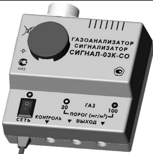
Рис. 1. Общий вид сигнализатора «СИГНАЛ-03К-СО»